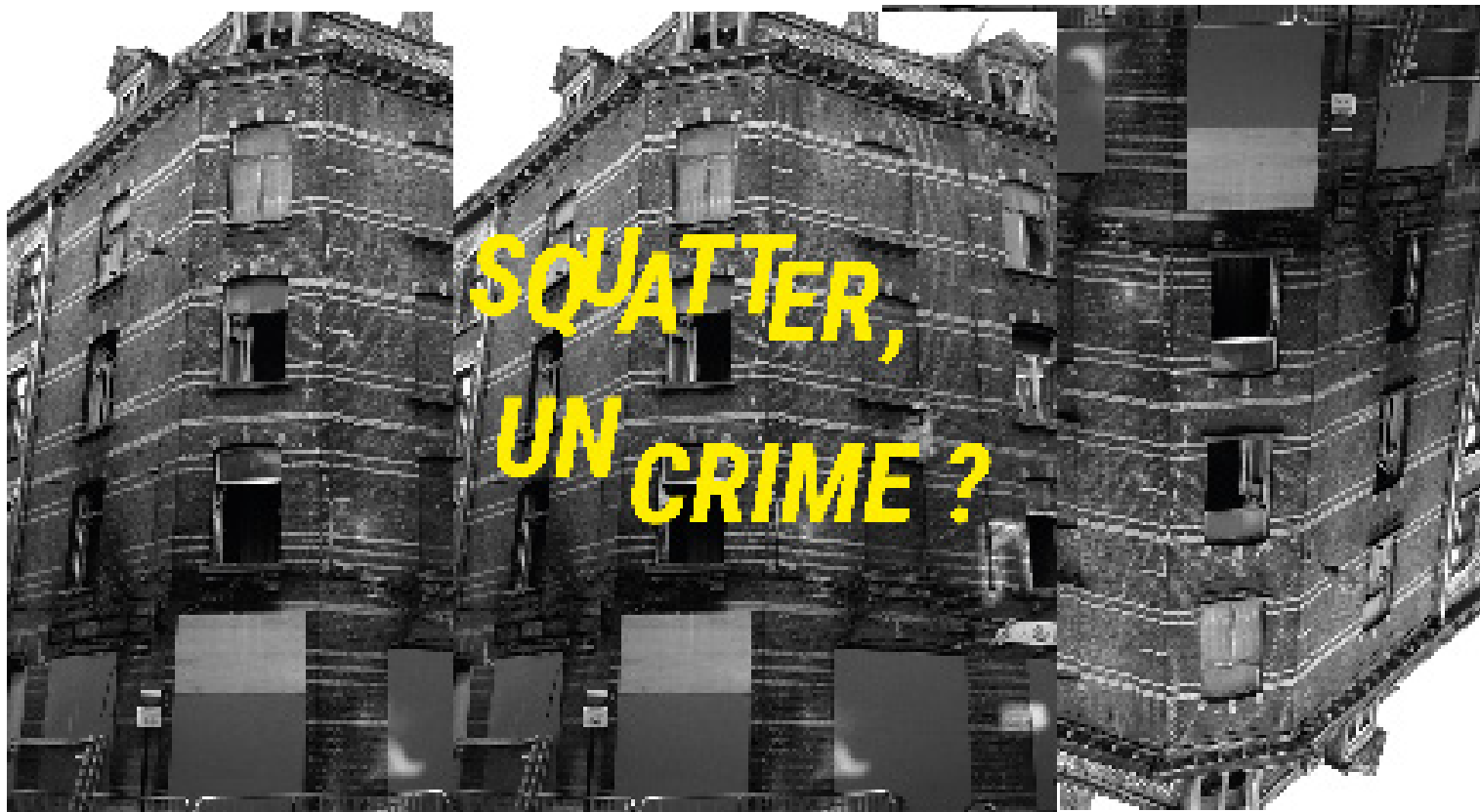
La nouvelle loi relative à la pénétration, l'occupation ou le séjour illégitimes dans le bien d'autrui.

J eudi 5 octobre 2017. 20h passées de quelques minutes. A la majorité de 84 voix pour, 29 contre, et 22 abstentions, la Chambre des Représentants adopte « une proposition de loi relative à la pénétration, à l'occupation ou au séjour illégitimes dans le bien d'autrui ». Les dispositions qui y sont prévues sont inadmissibles car elles visent à pénaliser toute forme d'occupation, sans prendre en compte la réalité du terrain, la vacance immobilière et la pénurie de logements abordables. L'introduction d'une infraction pénale pour sanctionner le squat est tout à fait disproportionnée en regard du « danger » éventuel qu'il pourrait constituer. Ce n'était la solution prônée par aucun des acteurs en présence, ni les squatteurs et associations du secteur de la pauvreté et du logement bien sûr, ni le Conseil d'Etat, ni les Juges de Paix, ni les Procureurs, ni même les représentants des propriétaires ! En pénalisant l'occupation de bâtiments vides, le législateur rompt l'équilibre entre le droit de propriété et le droit au logement. Il privilégie nettement le premier, quand bien même le fait de conserver un logement vide est une infraction à Bruxelles, au détriment du second, en sanctionnant ceux qui ont simplement besoin d'un toit.