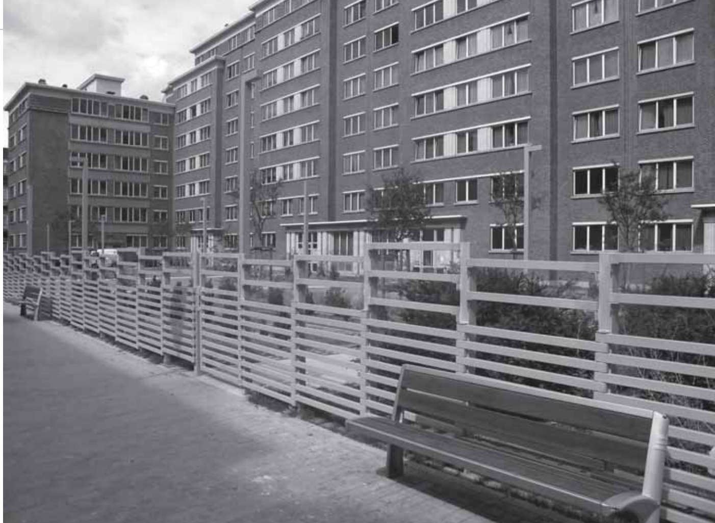
Beliris investeert 12,5 miljoen euro in 2007 in de sociale huisvesting

of renoveren van een woning tot passiefhuis. De belastingvermindering bedraagt 780 euro per jaar en per woning en dat gedurende 10 jaar.