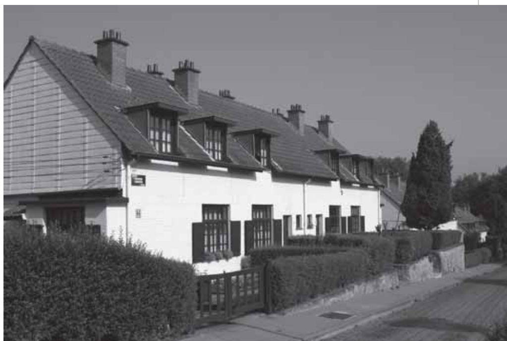
Brussel telt slechts 8% sociale woningen

Dat is tenminste onze overtuiging, nu nog de anderen hiervan overtuigen.