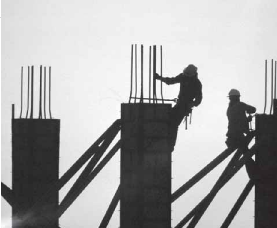
Huisvesting zal niet het grote verwachte bouwterrein van de aftredende coalitie geweest zijn.

Ander punt : de bekendmaking geldt enkel voor de gemeenschappelijke